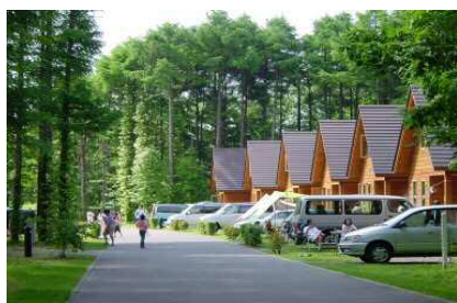
オートリゾート 苫小牧アルテン

知る人ぞ知る、樽前山麓の林間にひっそりと存在する苫小牧の秘境☆季節や天候にも左右されますが、運が良ければ、幻想的な景色に出会えるかも…※岩盤崩落の危険があるため川辺には降りないでください。